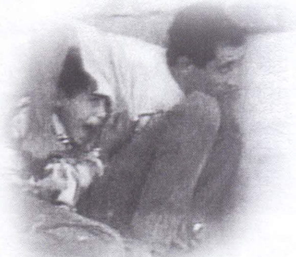
نجم في السماء الشهيد الدرهم