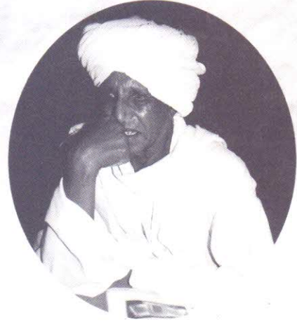
البروفيسور عبد الله الطيب وحديث الذكريات