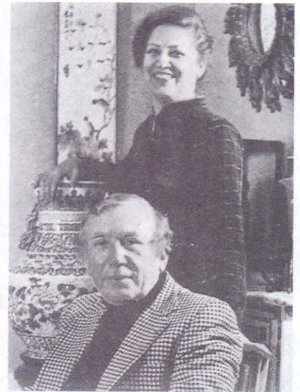
في مرثية نزار قباني لزوجته بلقيس