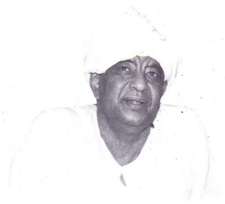
العلاق محمد وردي بين الغناء للنضال والعاطفة