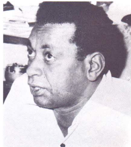
هد هي رحلة أم هجرة