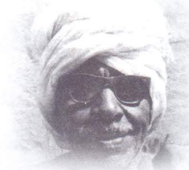
مع شيخ شعراء السودان