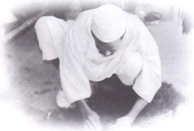
السودانيون أفضل من يجيد صناعة الجلود