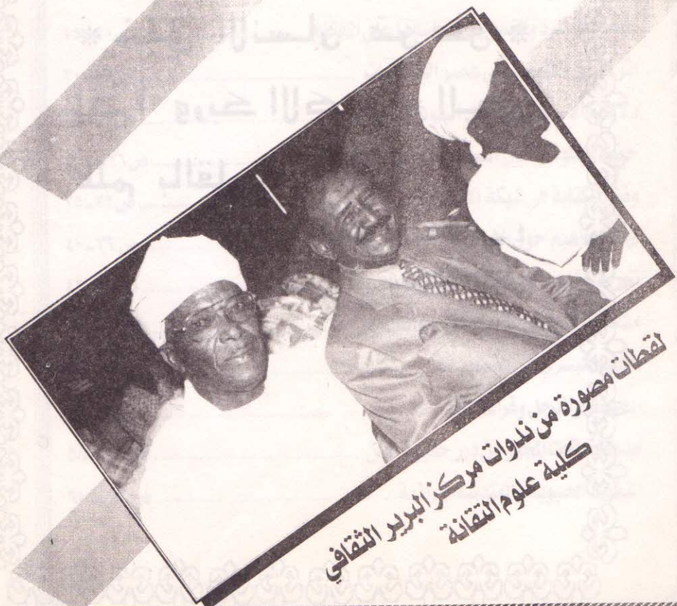
لقطات مصورة من ندوات مركز البيرير الثقافي كلية علوم التقنية